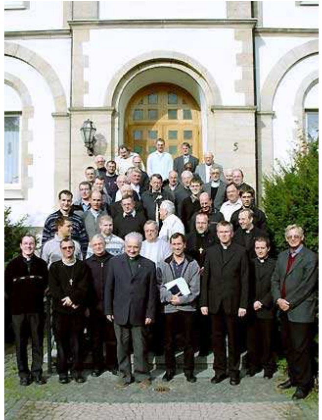
Bonifatiuskloster Hünfeld, Pforte

Wurde an einem Oktobersonntag in Maria Taferl am Kirchenplatz Käse für die Renovierung der Basilika versteigert, so gibt es Anfang November wieder ein großes Konzert. Der Verein Choroester Cantabile bringt mit ca. 80 Sängerinnen und Sängern und eben so vielen Mitwirkenden im Orchester das Te Deum von Anton Bruckner und die „Grande Symphonie Funebre Et Triumphale“ von Hector Berlioz zur Aufführung.