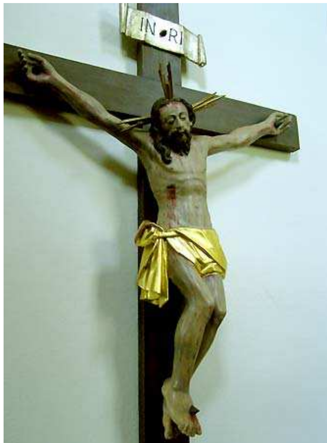
Kreuz in der Beichtkapelle, Pfarrkirche Krumbach NÖ

2 Prälaten aus der Diözese Bamberg haben wieder einmal eine Urlaubswoche im Oblatenkloster verbracht. Zu den verschiedenen Eindrücken, die so eine Großstadt zu bieten hat, kommt in diesem Winter auch wieder einmal die „weiße Pracht“ zur Entfaltung.