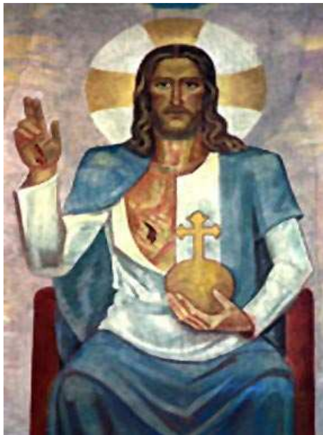
Apsisbild in der Herz-Jesu-Kirche in Gmünd-Neustadt

prägen oft den letzten Monat des Pfarrjahres vor einer gewissen Sommerpause. Das Pfarrfest in der Pfarre Gmünd-Neustadt findet am 20./21. Juni statt. Es gibt auch einen Flohmarkt. Die Senioren machen sich nach Ottenschlag und Kirchschlag zu einem Ausflug auf den Weg.